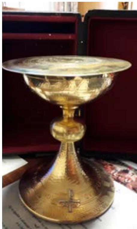
Caliz y patena estilo clásico