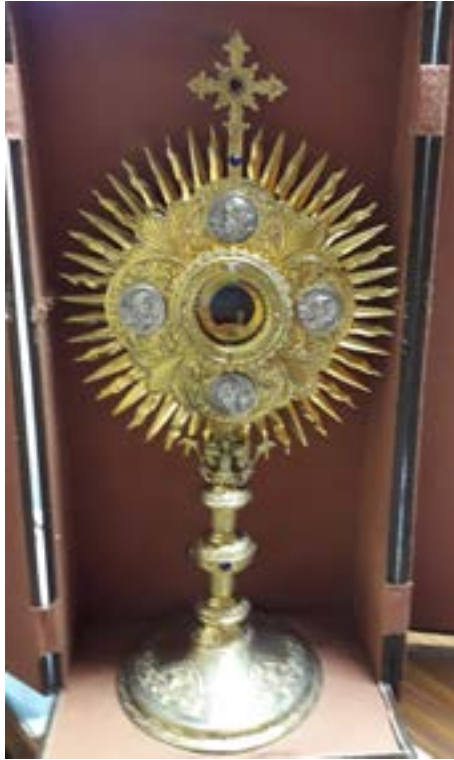
Custodia de 70 cm de alto