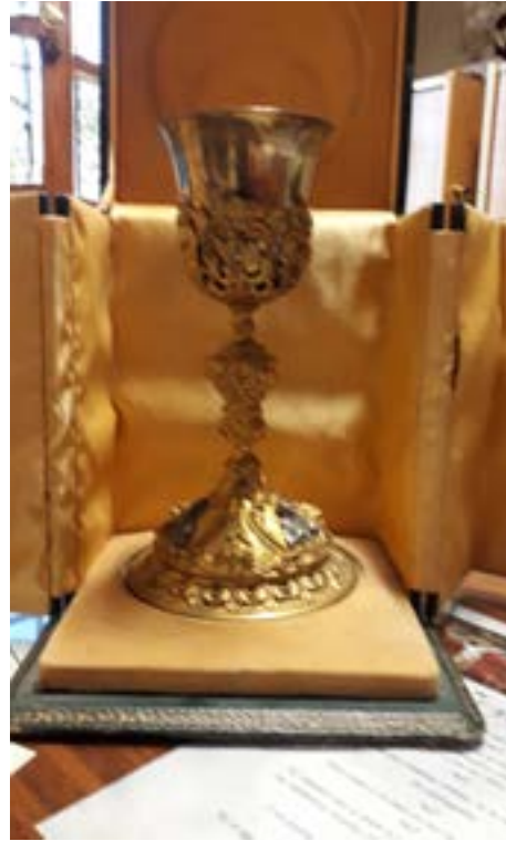
Caliz estilo barroco